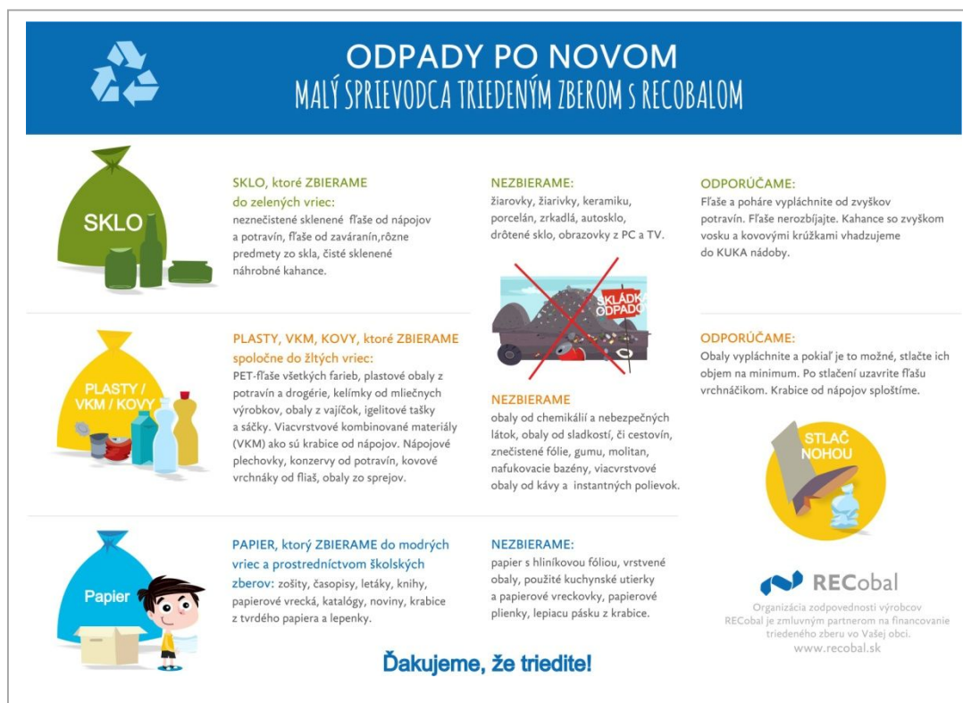
Obrázok .1 / Ukážka štandardného letáku distribuovaného v zmluvných obciach v II. Polroku 2016

Na lokálnej úrovni boli zo strany OZV RECObal uskutočnené rôzne formy propagácie: